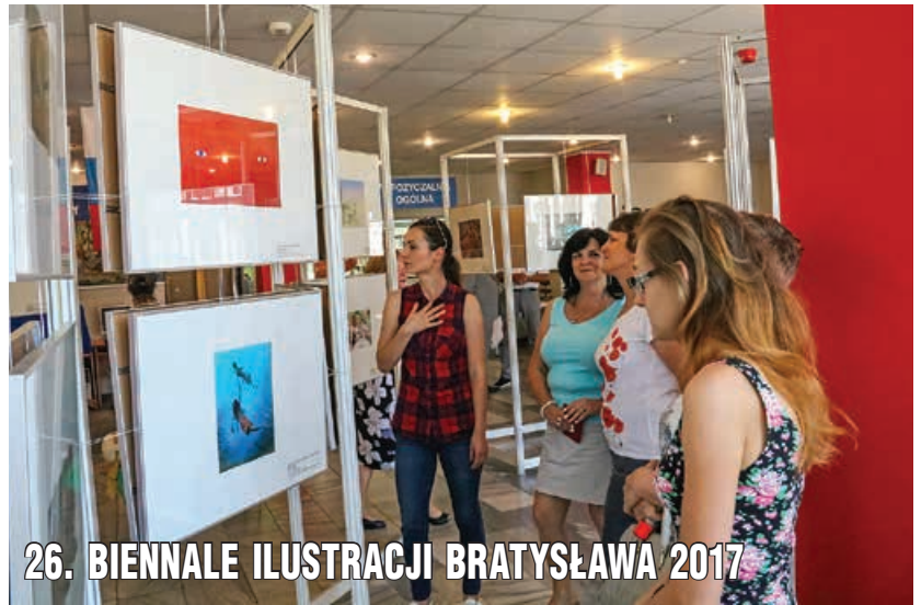
26. BIENNALE ILUSTRACJI BRATYSŁAWA 2017