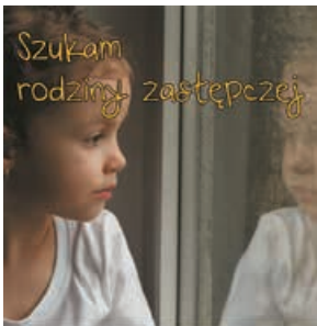
Kampania na rzecz rodzicielstwa zastępczego