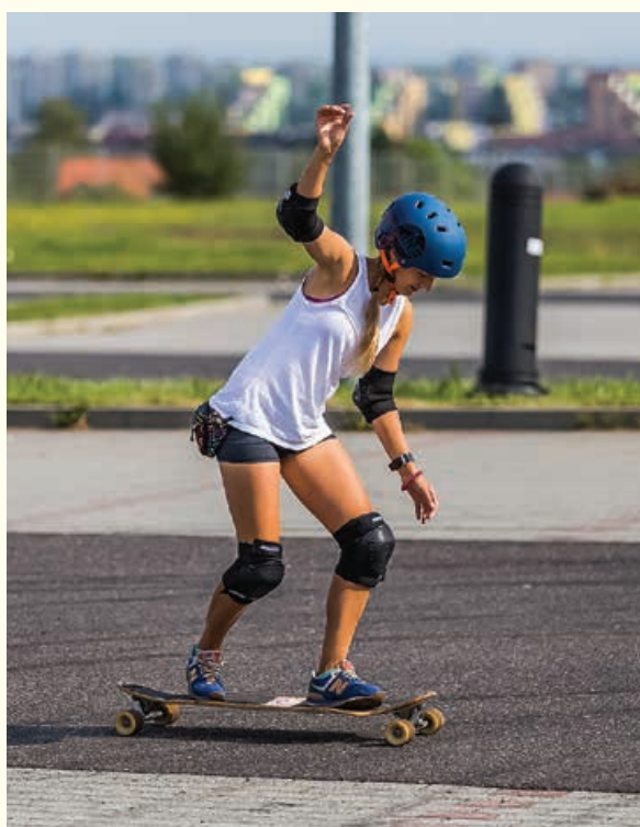
Warsztaty jazdy na longboardzie zorganizował 20-24 sierpnia Bielsko-Bialski Ośrodek Sportu i Rekreacji.