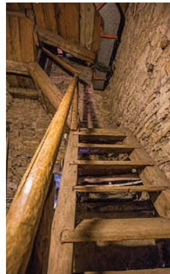
Wnętrze wieży kościoła św. Stanisława