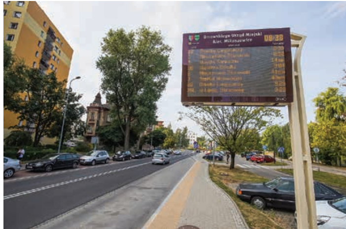
Elektroniczny wyświetlacz na przystanku w centrum miasta

Informacja pasażerska z nowymi funkcjami dostępna jest pod adresem internetowym rozklady.bielsko.pl. Można przy jej pomocy uzyskać szerszą informację m.in. o przystankach, liniach autobusowych oraz godzinach odjazdów