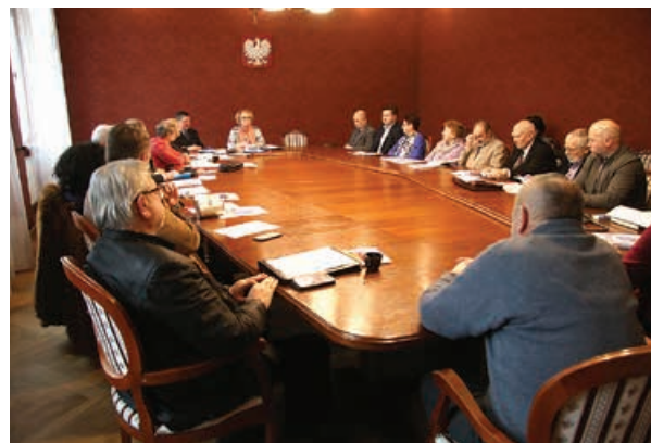
Marcowe spotkanie rady w Ratuszu

Na spotkaniu omawiano również działanie zespołów problemowych rady. Rada składa się z 15 przedstawicieli osób starszych i podmiotów działających na ich rzecz, zwłaszcza organizacji pozarządowych oraz podmiotów prowadzących uniwersytety trzeciego wieku. Została powołana w 2015 r. na czteroletnią kadencję. Do zadań rady należy m.in. konsultowanie priorytetów w zakresie zadań realizowanych przez miasto na rzecz osób starszych, opiniowanie projektów aktów prawnych dotyczących tych osób, inicjowanie działań na rzecz seniorów, współpraca z organizacjami i instytucjami, wymiana doświadczeń z radami seniorów działającymi w innych gminach. Szczegółowe informacje na temat funkcjonowania Rady Seniorów można znaleźć na stronie www.seniorzybielsko.pl . opr. Jack