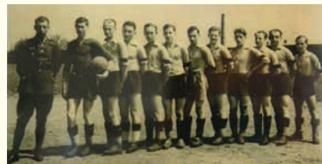
Piłkarze z Bielska, 1935 r.

Do dziś z klubów wywodzących się z BBTS-u funkcjonują tylko sekcje piłki nożnej – BBTS Podbeskidzie i TS Podbeskidzie, siatkówki – BBTS Bielsko-Biała występujący w Plus Lidze oraz BBTS Włóknierz szkolący młodzież; zaś spadkobiercą bokserskich osiągnięć BBTS-u jest Bielski Klub Bokserski Beskidy. Wszystkie te kluby połączyły siły, żeby wspólnie świętować jubileusz 110-lecia swojego wspólnego przodka. Główne uroczystości zostały zaplanowane na początek kwietnia. opr. Jack