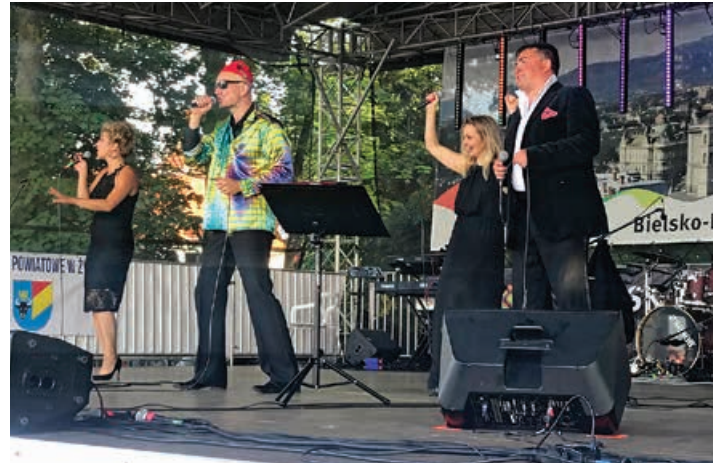
Bielscy aktorzy, czyli BB Vocal Group

14 lipca rozpoczęły się główne atrakcje Bielsko-Biała i Beskidy w Ustce . Od rana na plaży trwały rozgrywki 16. Międzynarodowego Turnieju Siatkówki Plażowej o Puchar Przewodniczącego Euroregionu Beskidy przygotowane przez Bielsko-Biański Ośrodek Sportu i Rekreacji. BBOSiR na usteckiej promenadzie organizował przez dwa dni również zabawy zręcznościowe dla małych i dużych pod hasłem Baw się razem