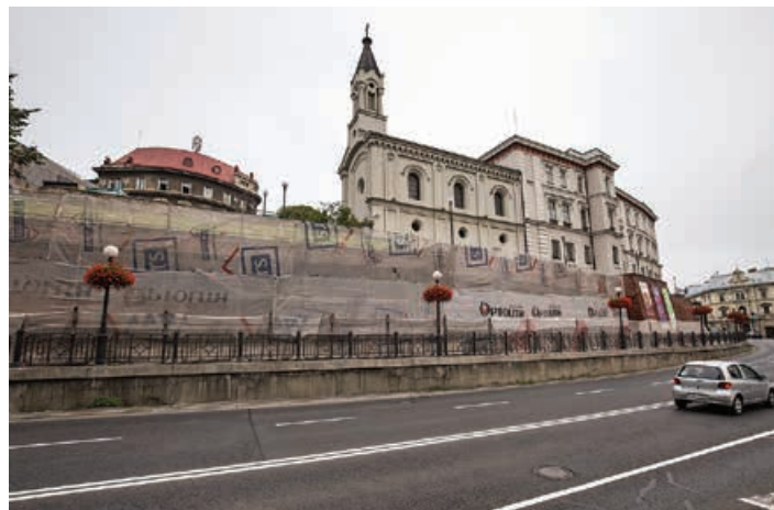
Remont muru zamkowego