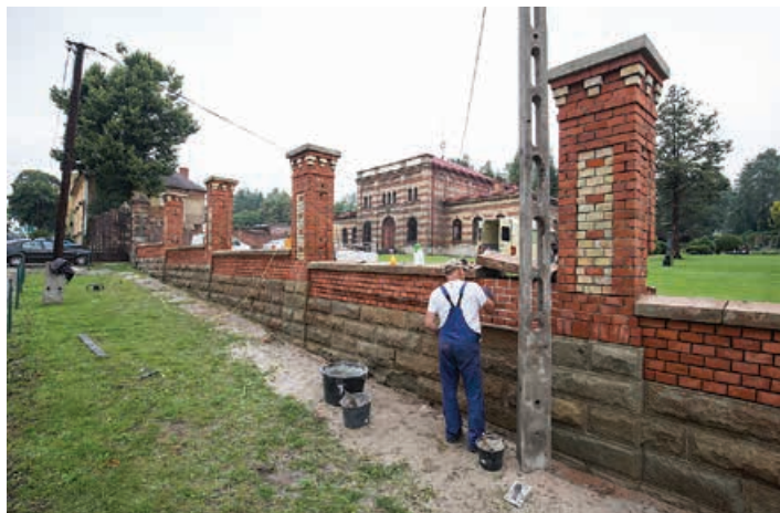
Prace przy Cmentarzu Żydowskim