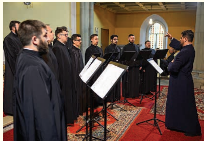
Evolgia – Bizantyjski Chór Prawosławny patriarchy Rumunii