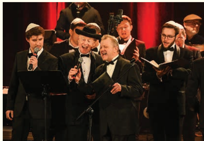
The Moscow Male Jewish Capella

MUZYCZNA MODLITWA – dokończenie ze str. 1 i 3