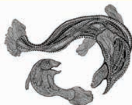
Natalia Kłęczar, Rybne ilustracje 12