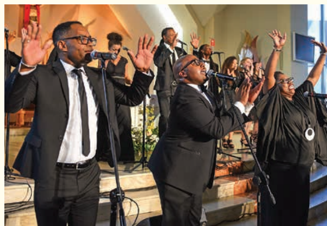
The Real Rogers and Friends