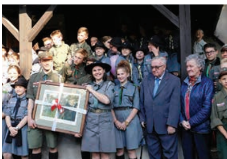
Majówka z ZHR