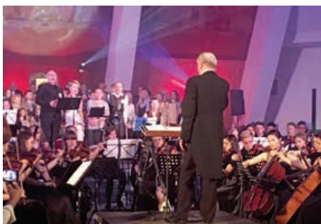
Koncert dla Drachmy

go harcerzom i ich rodzinom, zorganizowano 19 maja majówkę, w której uczestniczyło ok. 250 osób. W programie znalazły się wydarzenia integrujące, a także akcenty edukacyjne i patriotyczne, upamiętniono również postać gen. Józefa Hallera.