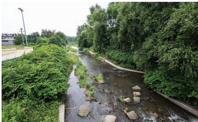
Dzике nabrzeża rzeki Białej