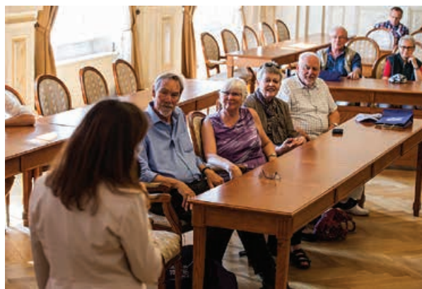
Goście z Wolfsburga w sali sesyjnej