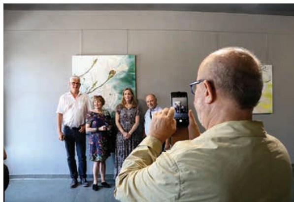
Wystawa Bettiny Hackbarth w Galerii PPP