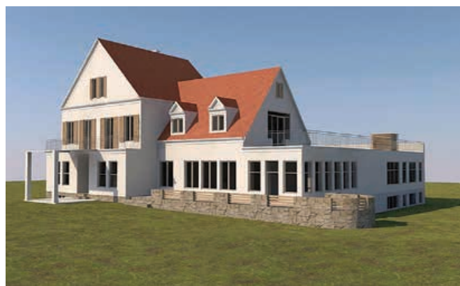
Wizualizacja planowanego Centrum Edukacji Ekologicznej przy ul. Grotowej

Urząd Miejski stara się o środki na realizację projektu Rewitalizacja miejskich systemów nadbrzeżnych wraz z utworzeniem Centrum Edukacji Ekologicznej . Środki są zapisane w Regionalnym Programie Operacyjnym Województwa Śląskiego, projekt należy do tzw. projektów kluczowych, więc nie dotyczy go tryb konkursowy, fundusze ma zagwarantowane. Jednak żeby je otrzymać, projekt musi spełnić wymagane kryteria.