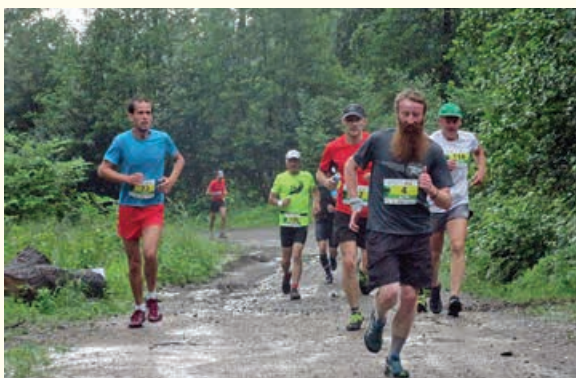
Bieg na Chrobaczą Łąkę

16. Bieg na Chrobaczą Łąkę rozegrano 3 czerwca. Jego organizator Centrum Sportowo-Widowskowe w Kozach przygotował nową, 14-kilometrową trasę z metą na szczycie Hrobaczej Łąki w Beskidzie Małym. Swoją udział w biegu zgłosiło 151 osób, ostatecznie z powodu trudnych warunków atmosferycznych, w zawodach wystartowało 113 osób.