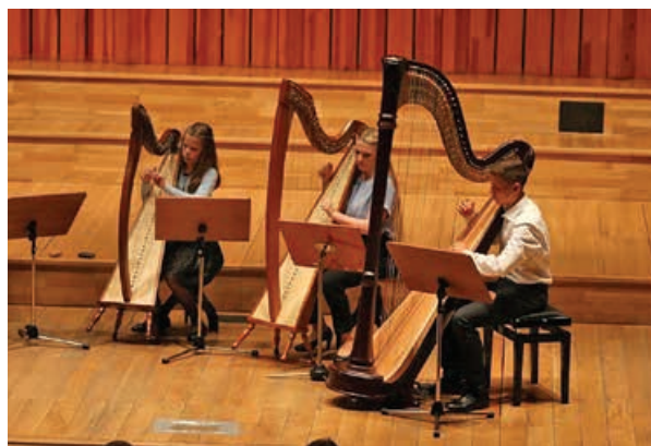
Muzyka harfowa bez granic