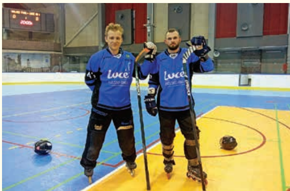
Hokej na rolkach

Podczas czterech turniejów zespoły zagrają każdy z każdym mecz i rewanż. Zespoły walczą o prawo gry w turnieju finałowym, który odbędzie się w dniach 22-24 czerwca w Cieszynie. Do finałów awansują cztery najlepsze drużyny w grupie.