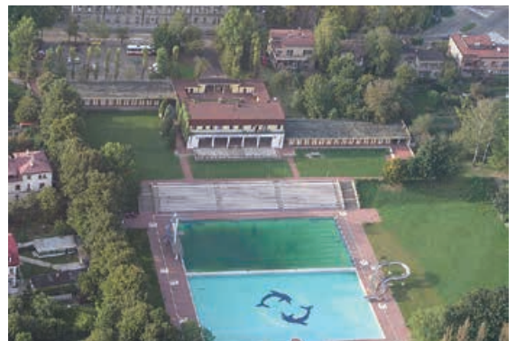
Kąpielisko Panorama z lotu ptaka