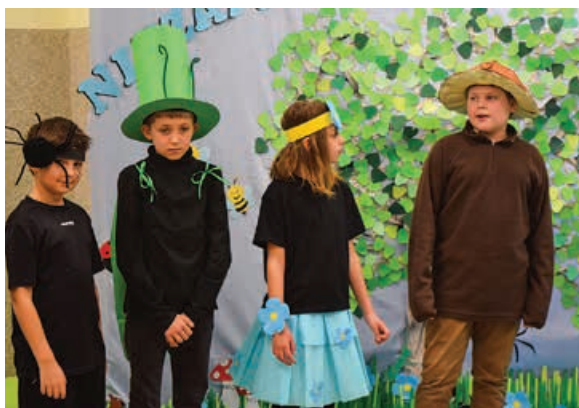
Spektakl Przyjaźń – Święto niezapominajek