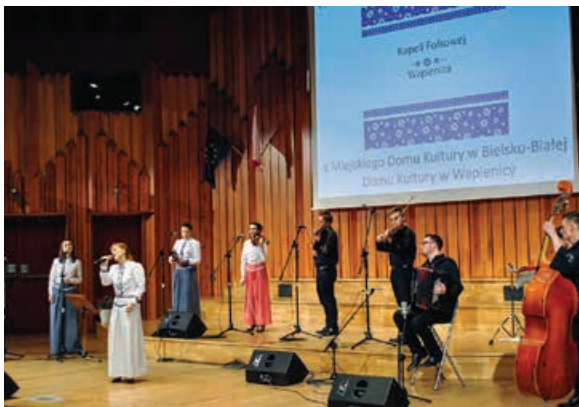
Jubileuszowy koncert Kapeli Folkowej Wapienica

Kapela z okazji swojego jubileuszu nagrała płytę z kołędami. opr. Jack