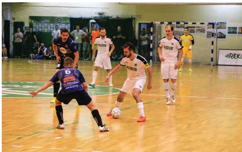
Halowi piłkarze Rekordu mają na koncie liczne sukcesy