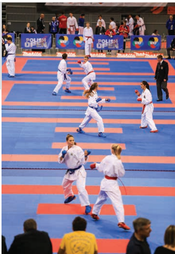
Polish Open Karate w hali pod Dębowcem