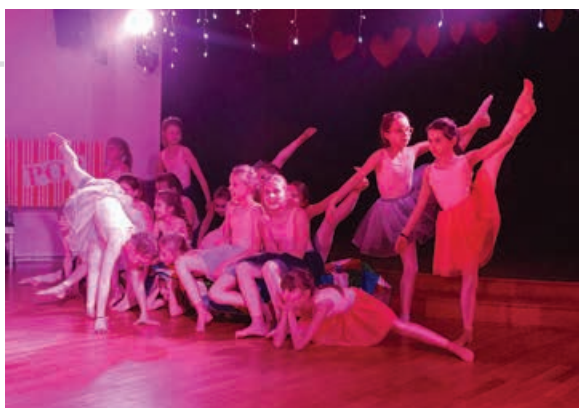
Prezentacje w DK w Olszówce