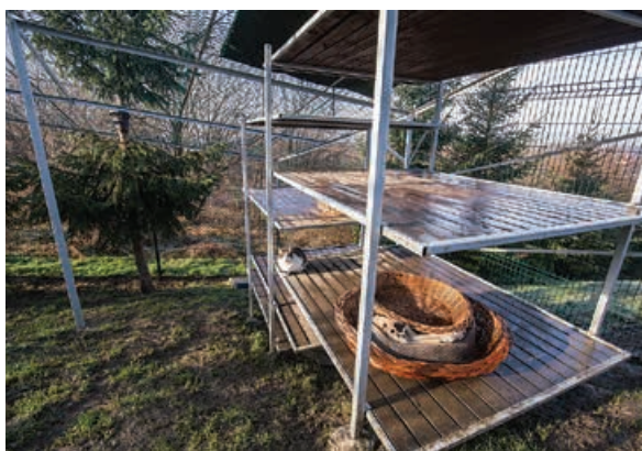
Nowe wybiegi dla psów i kotów