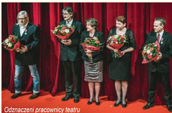
Odznaczeni pracownicy teatru