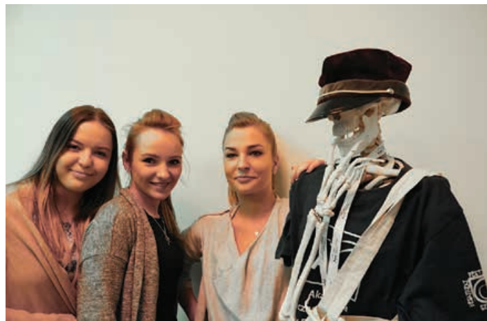
Studentki ATH, które przeszły przez escape room