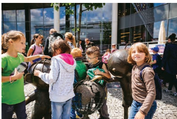
Książka wspiera bohatera