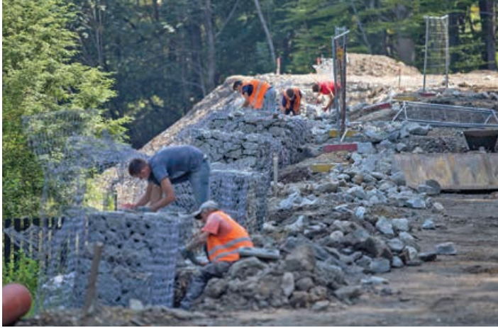
Prace na ul. Dębowiec