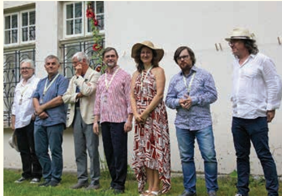
Uczestnicy pleneru malarskiego w Bystrej