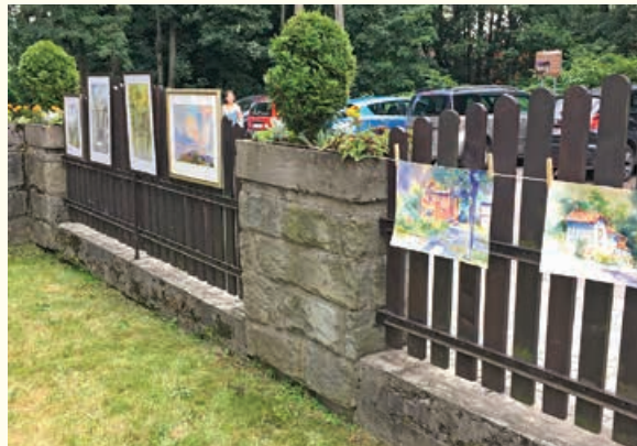
Piknikowa wystawa w Fałatówce