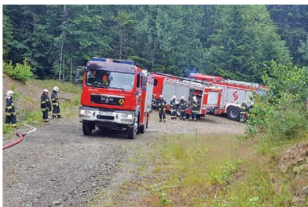
Strażackie ćwiczenia w lesie