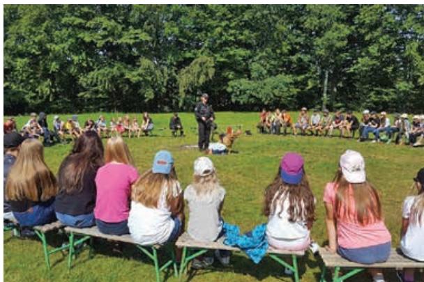
Strażacy edukowali harcerzy

http://www.katowice.kwpsp.gov.pl/resources/Bezpieczenstwo/Bezpieczne_wakacje.pdf .