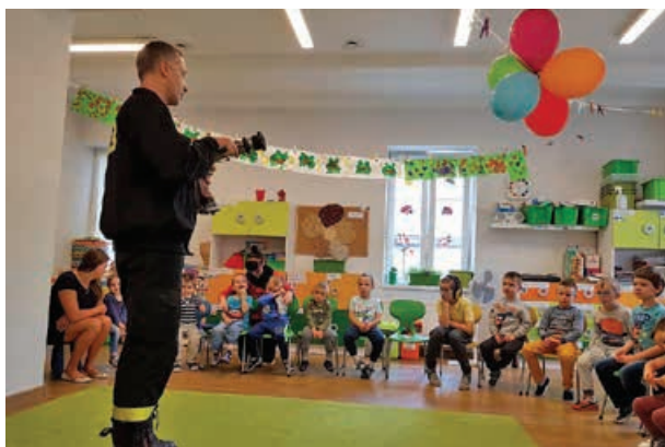
Spotkanie z przedszkolakami