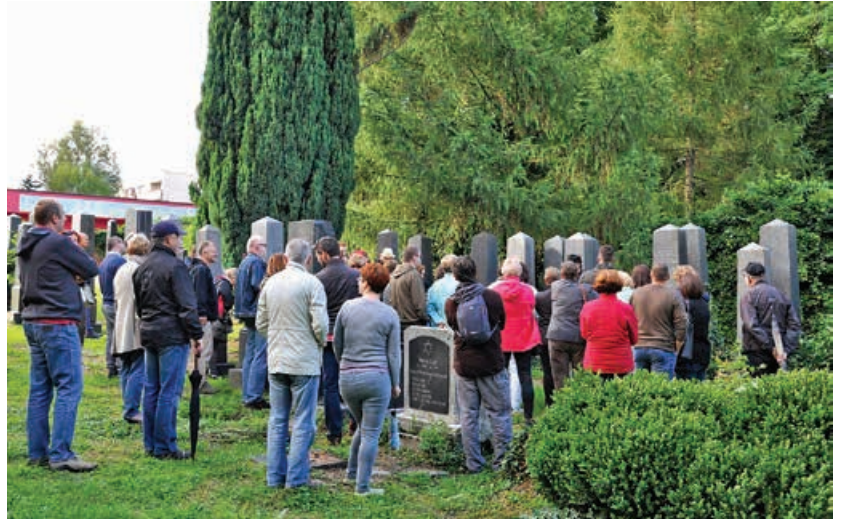
Uczestnicy spaceru po cmentarzu żydowskim

Spacery o tematyce niepodległościowej przygotował Wydział Promocji Miasta Urzędu Miejskiego w Bielsku-Białej, wpisując je w program obchodów 100-lecia odzyskania przez Polskę niepodległości.