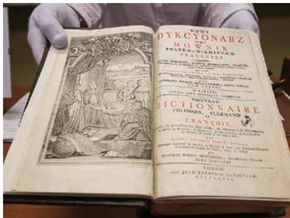
Urszula Szabla prezentuje starodruki