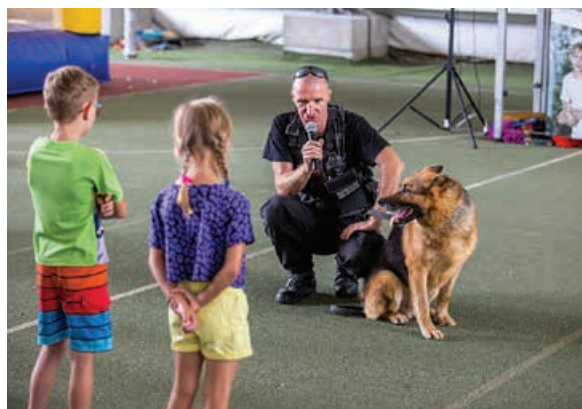
Pokaz umiejętności psa policyjnego