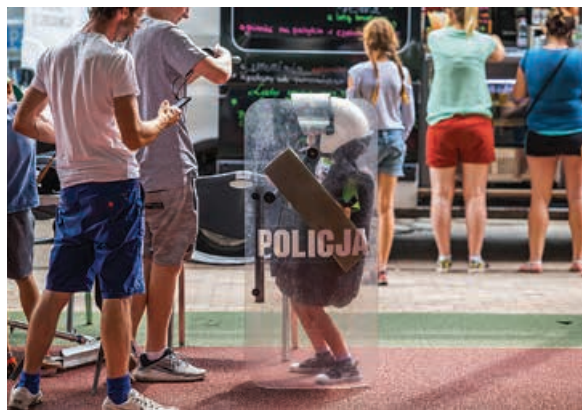
Sprzęt policyjny wzbudzał zaciekawienie