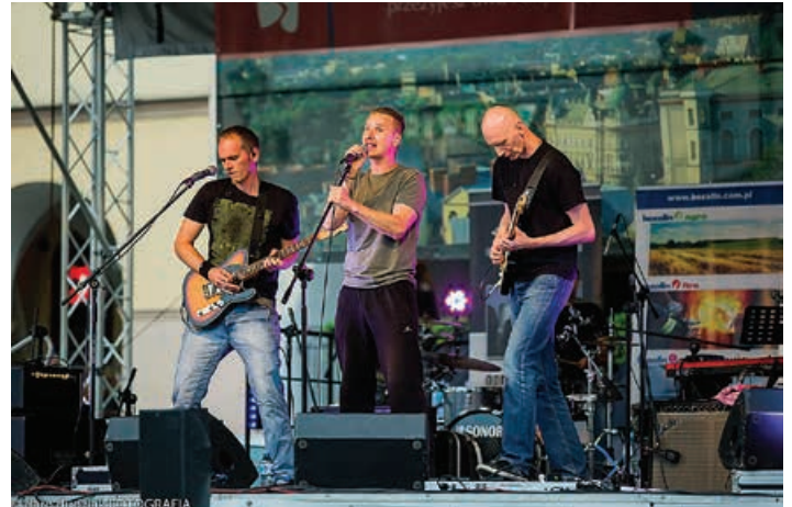
Not To Say – trzecia nagroda przeglądu