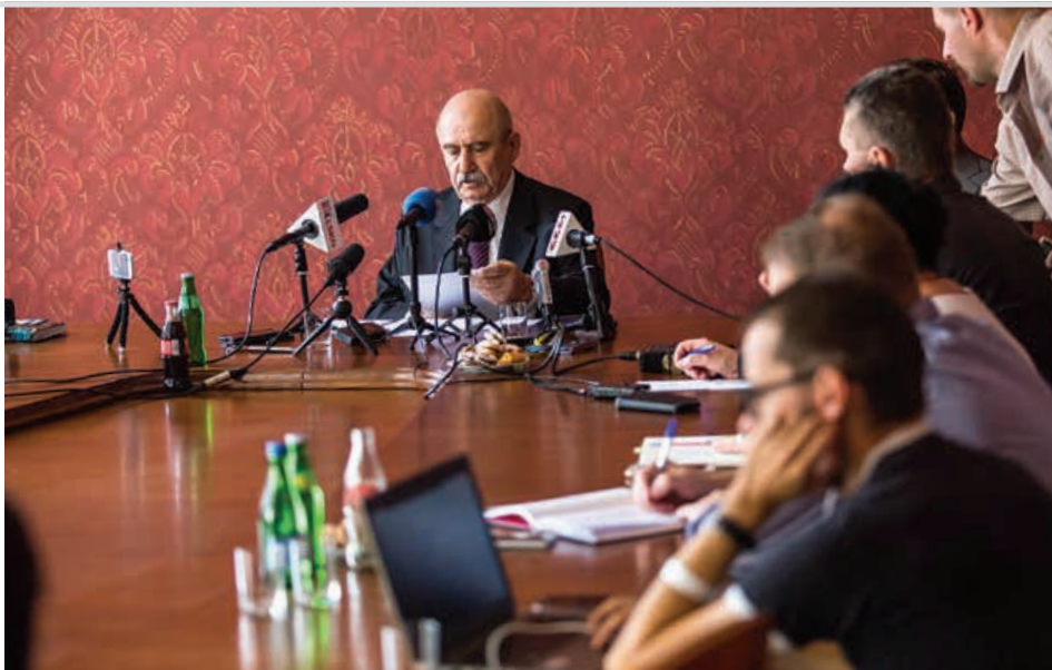
Konferencja prasowa prezydenta Jacka Krywulta w Ratuszu

– Zmodernizowano bazę Centrum Kształcenia Ustawicznego i Praktycznego, wybudowaliśmy gimnazjum z salą gimnastyczną w Wapienicy, nowe sale gimnastyczne dla szkół nr 26 i 9, nowe przedszkole