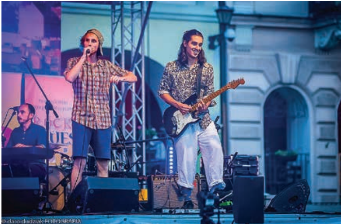
Zwycięzca siódmego PPM – Mikrokosmos