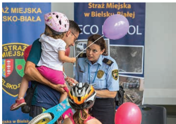
Stoisko Straży Miejskiej