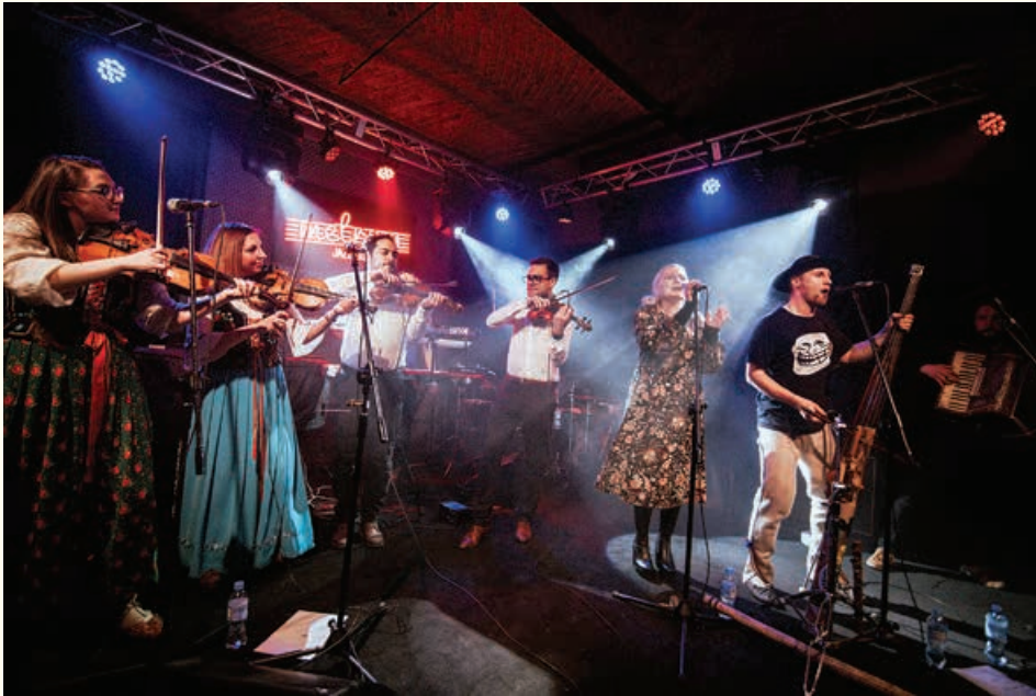
Psio Crew gra z The ThreeX