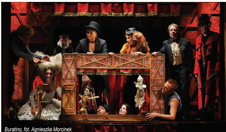
Buratino