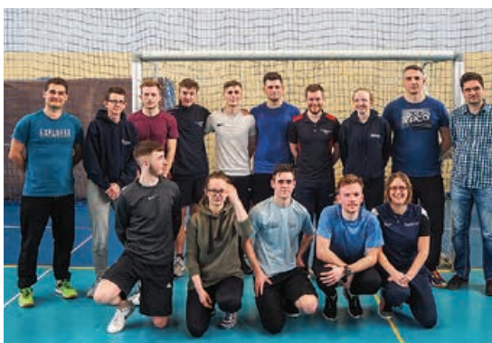
Brytyjczycy w Zespole Szkół im. J. Tuwima