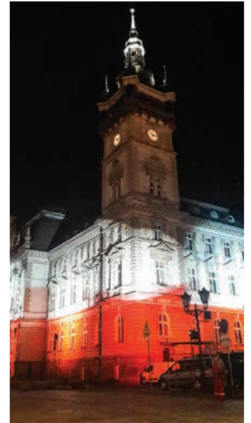
Bialo-czerwona iluminacja Ratusza