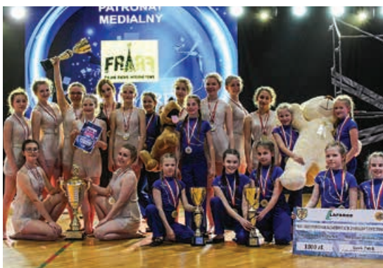
Jarzębinki z nagrodą