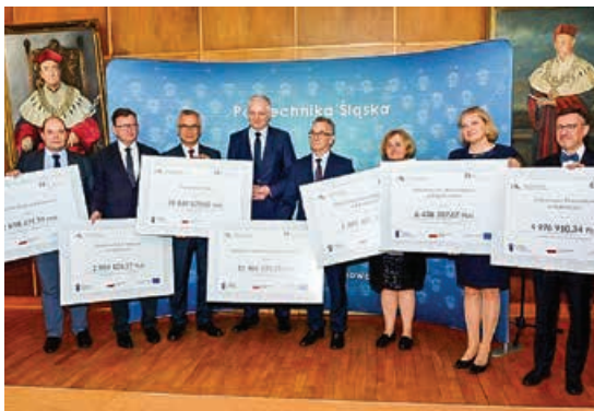
Czeki dla uczelni

Na małej scenie Teatru Polskiego 13 kwietnia odbyły się eliminacje rejonowe 63. Ogólnopolskiego Konkursu Recytatorskiego. To najstarszy i największy konkurs recytatorski w kraju adresowany do młodzieży ze szkół ponadgimnazjalnych i dorosłych. Rywalizacja odbywa się w czterech turniejach: recytatorskim, poezji śpiewanej, teatrów jednego aktora i wywiedzione ze słowa, zaś eliminacje są kilkustopniowe, począwszy od przeglądów środowiskowych po finały ogólnopolskie. Głównym organizatorem OKR jest Towar-