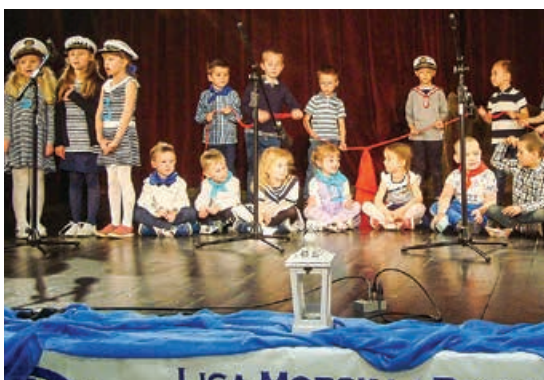
Szanty w wykonaniu dzieci