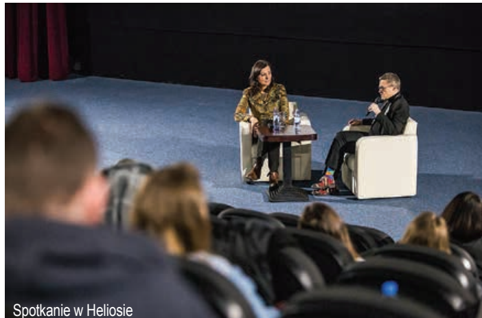
Spotkanie w Heliosie

W teatrze wręczono nagrody laureatom regionalnego konkursu wiedzy o teatrze, nazwanego Bielskie Teatra-