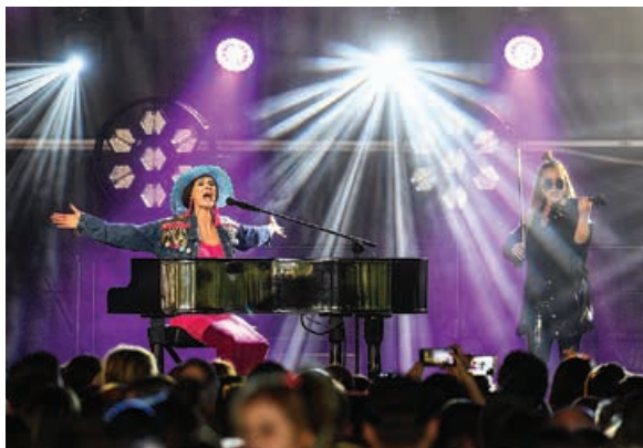
Majówka pod Dębowcem – koncert Sylwii Grzeszczak