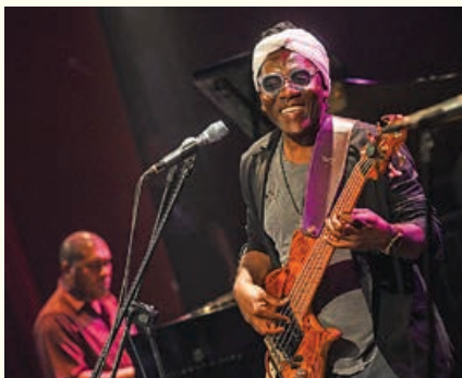
Richard Bona

Po raz pierwszy ten pochodzący z Kamerunu gitarzysta i wokalista przyjechał do Bielska-Białej w 1997 roku jako basista zespołu Joe Zawinula. W 2004 r. wystąpił z na bielskich łąkach wraz z Geraldem Toto i Lokuą Kanzą, zaś z solowym projektem Bonafied przyjechał do BCK w październiku 2013 r. Teraz Richard Bona wystąpił z muzykami Mandekan Cubano, przedstawiając materiał ze swojej najnowszej płyty zawierającej inspiracje bogatym dziedzictwem muzyki Afryki Zachodniej i Kuby. To był znakomity koncert, pełen bogactwa muzyki, inspiracji i improwizacji. wag