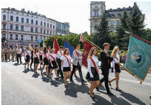
Uroczysty przemarsz przez centrum miasta