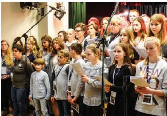
Uczestnicy warsztatów gospel