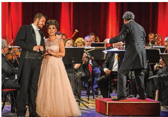
Koncert patriotyczny w BCK